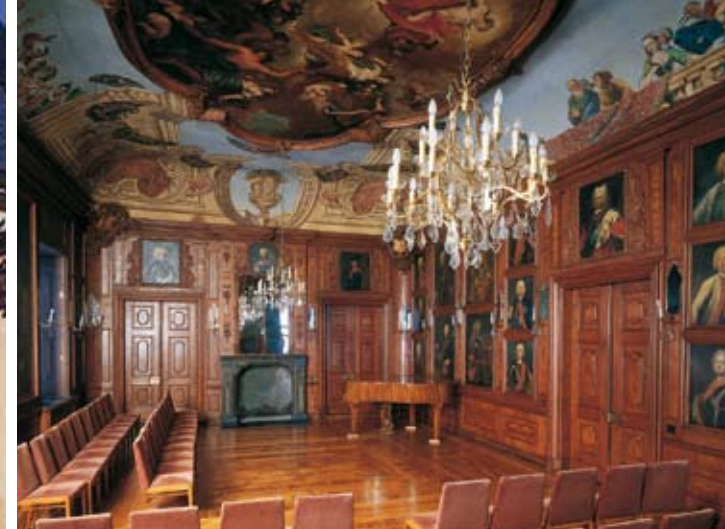
Der Festsaal