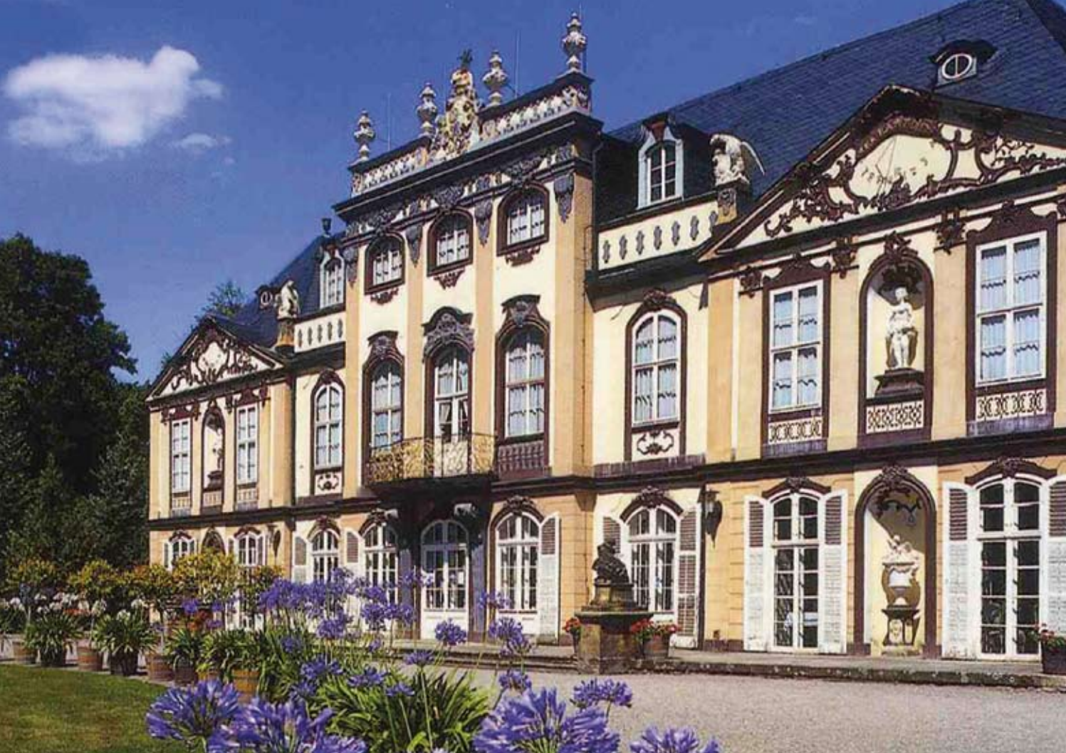
Schloss Molsdorf, Südfassade