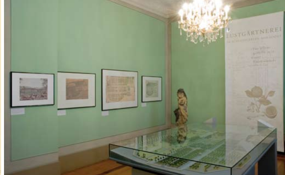
Blick in die Dauerausstellung