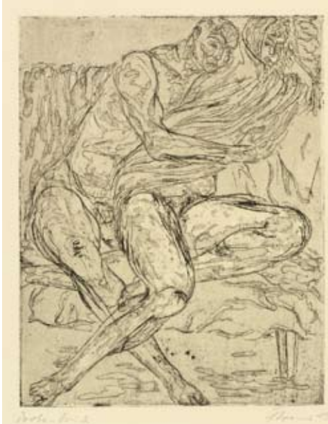
Fritz Cremer | Liebespaar 1967 | Aquatinta

Der Nachlass enthält eine Vielzahl von Studien und Skizzen zu Gemälden und Zeichnungen, die in vielen Thüringer Museen zu finden sind.