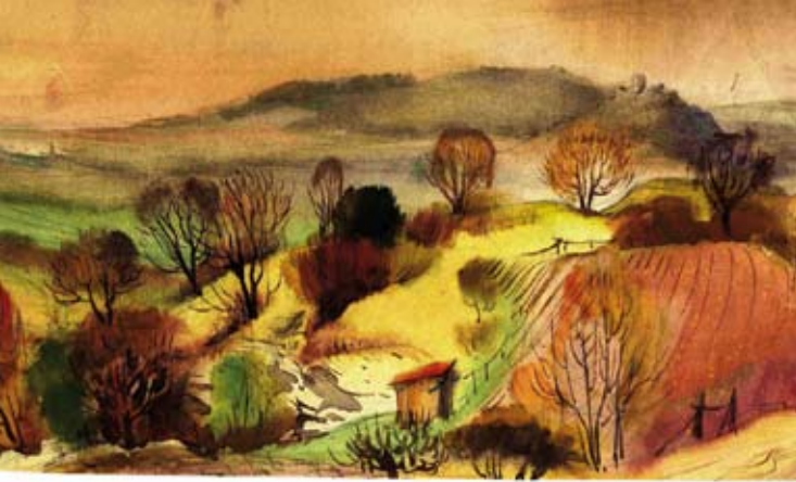
Otto Knöpfer | Blick in den Steinbruch | o. J. | Aquarell