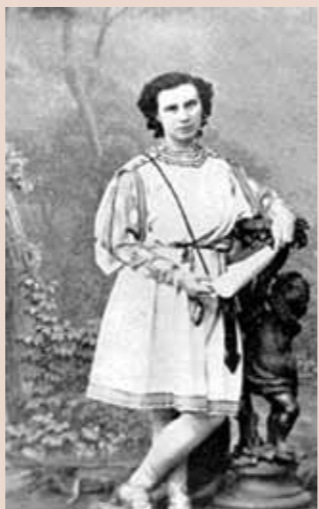
Herzog Georg II. von Sachsen-Meiningen als junger Erbprinz