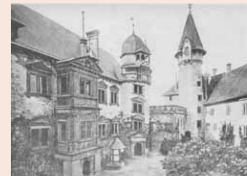
Die Terrasse auf dem „Jungfernbau“, die mit historisierenden Burg- zinnen versehen wurde, zwischen Französischem Bau (links) und dem großen Turm (rechts). Der große Turm wurde 1895 erhöht und ebenfalls umgestaltet.