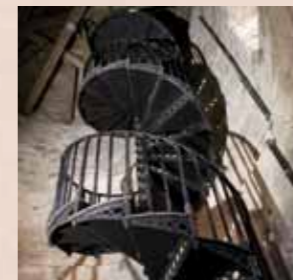
Gusseiserne Wendeltreppe im Aufgang zum Turm