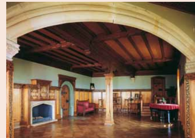
„Die Ausbildung des spätgotischen soll nicht künstlerisch kompliziert im Einzelnen sein, sondern so, wie man sich ein Burgzimmer des Mittelalters denkt.“ (Georg II.)