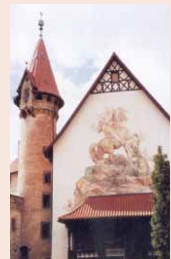
Heutige Ansicht des Wandbildes

Herzog Georg II. und Helene Freifrau von Heldburg, wie sie ihre Zeit auf der Veste Heldburg am liebsten verbrachten: Mit Kunst, Musik und angeregten Gesprächen unter Freunden.