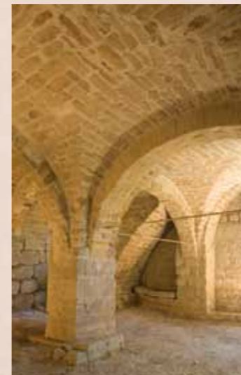
Kellergewölbe des ehemaligen Küchenbaus, freigelegt im 20. Jahrhundert