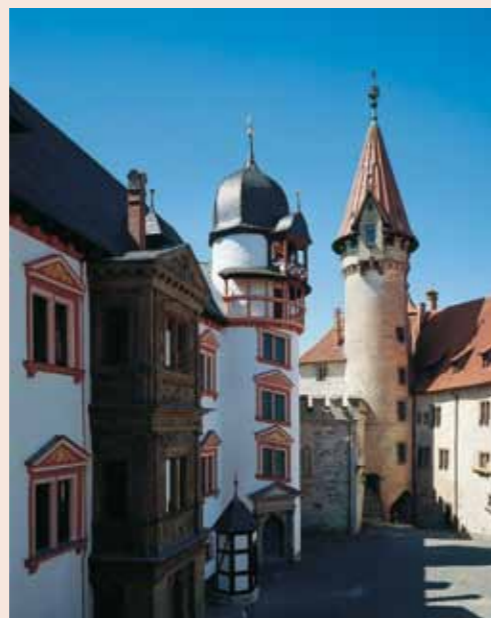
Innenhof der Veste Heldburg

Heute zeigt eine Ausstellung des Fördervereins Veste Heldburg e.V. die Geschichte der Veste sowie das Leben Herzog Georgs II. und der Freifrau von Heldburg. Neben dieser Dauerausstellung bietet der Förderverein ein breitgefächertes kulturelles Programm: Für die Besucher werden Führungen, zu besonderen Anlässen auch in historischen Kostümen, angeboten. Darüber hinaus finden Wechselausstellungen zu künstlerischen oder historischen Themen statt. In der Freifraukemenate veranstaltet der Förderverein jedes Jahr eine Konzertreihe mit kammermusikalischen Werken vom 18. bis zum 20. Jahrhundert, zu der Künstler aus ganz Deutschland eingeladen werden.